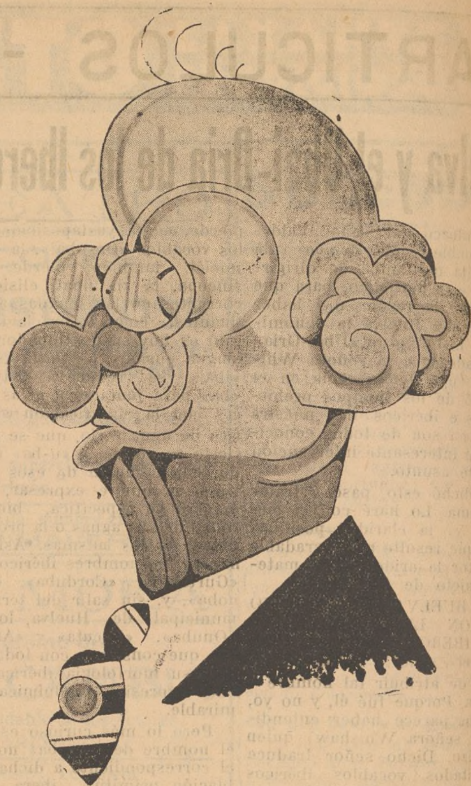
El jefe del Gobierno, don Alejandro Lerroux, que ha sido objeto de un homenaje con motivo de cumplir los 71 años de una vida consagrada a hacer efectiva la República en España.

tamiento y los Exportadores de vinos sobre consumo de operarios. En dicho laudo se propone que los exportadores paguen pesetas 0'10 por operario y día.