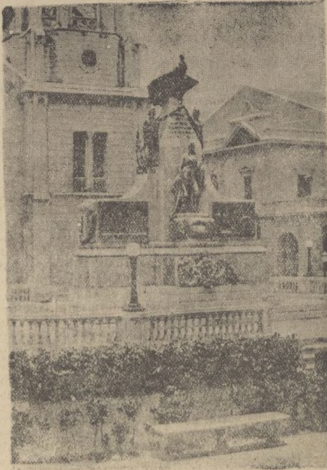
Monumento al Libertador Bolívar. (Vista de frente)