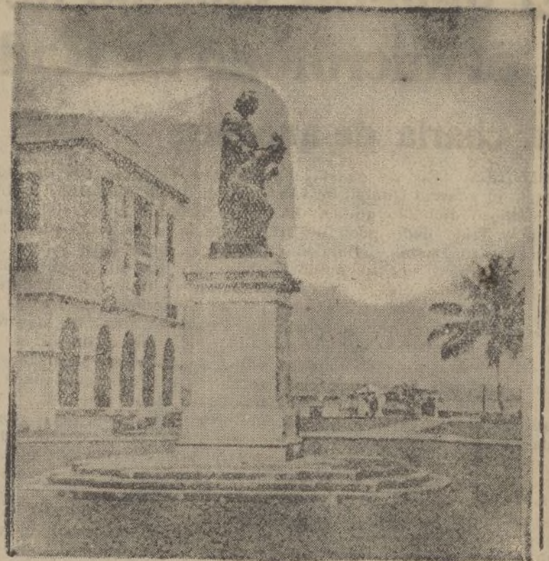
Estatua de Colón. Obsequio de Eugenia de Montijo, Emperatriz de los Franceses.

“Vigilad todos el espionaje enemigo. Denunciad y detened a los traidores”