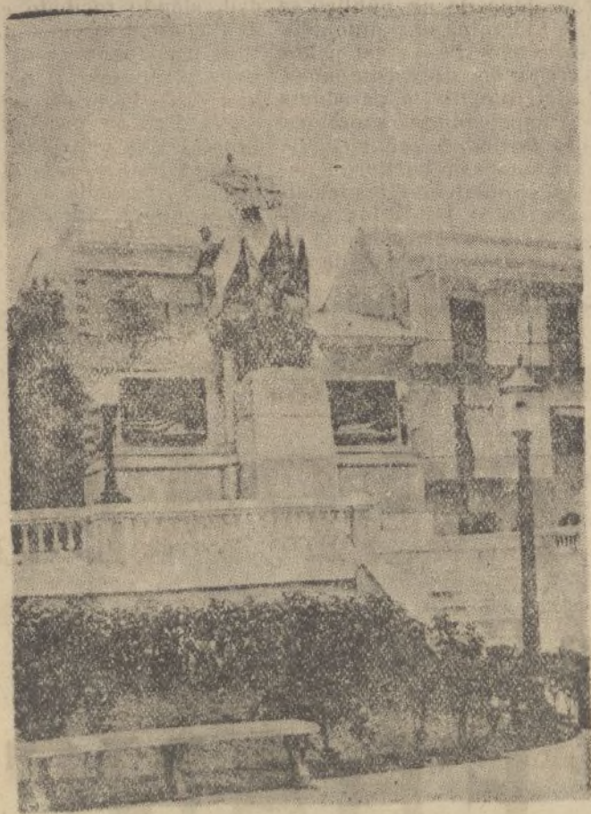
Monumento al Libertador. Bolívar (Vista posterior)