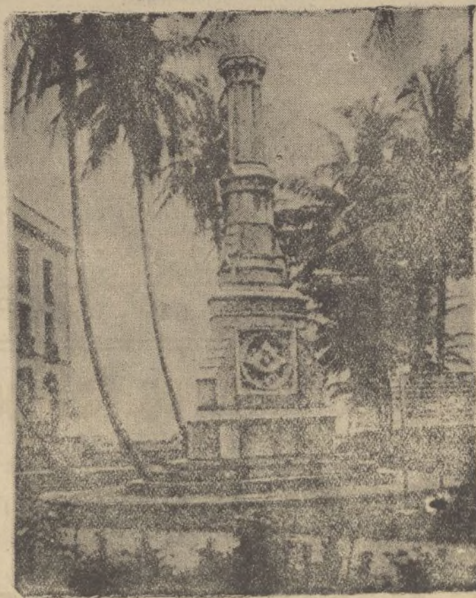
Monumento a Aspinwall, constructor del Ferrocarril Transistmico.