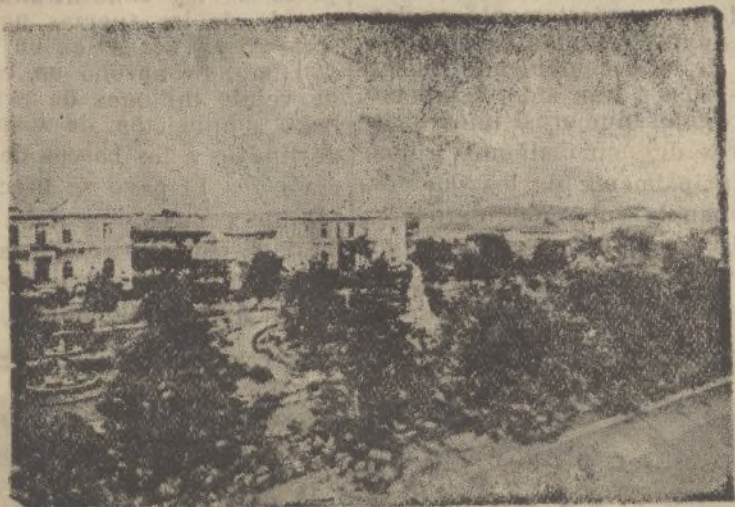
CIUDAD-PANAMÁ.—Plaza de Cervantes.