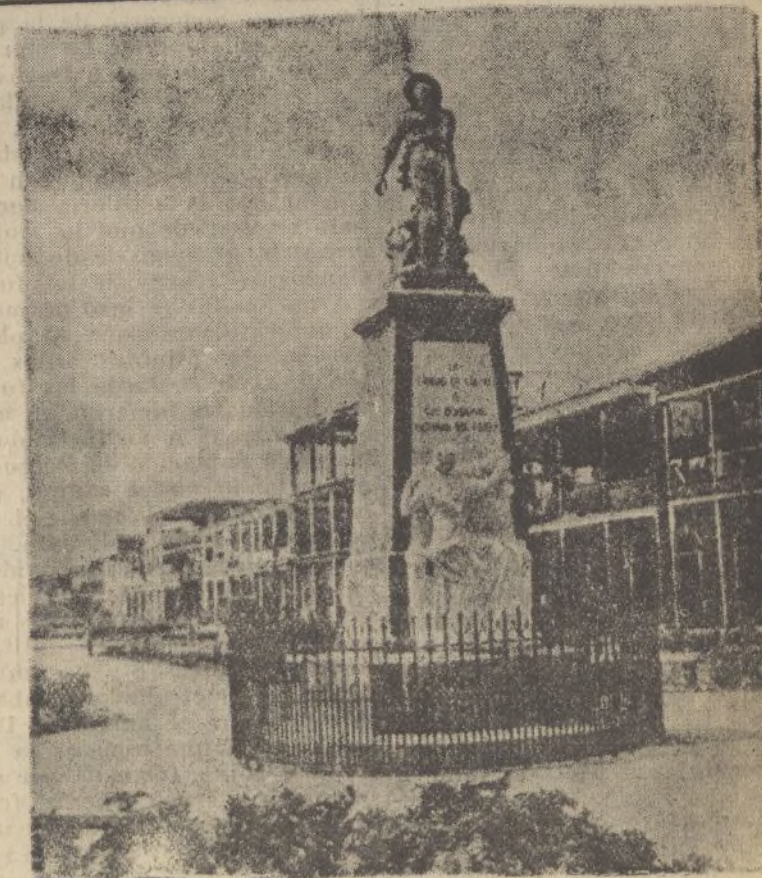
CIUDAD-COLÓN.-Monumento a los Bomberos