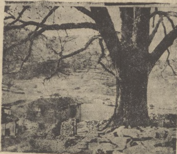
Un rincón del pintoresco Labayen Ayuntamiento de Madrid

En la Fiesta de los Reyes Magos del año 37.