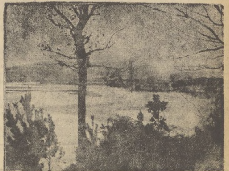
El Bidasoa convertido en río en Fuenterrabía