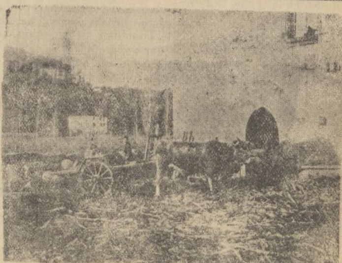
Casario de Arrayoz

Lea todas las mañanas «Diario de Huelva»