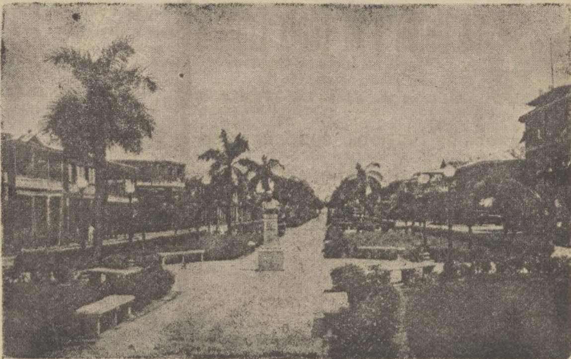
Avenida Manuel Amador Guerrero