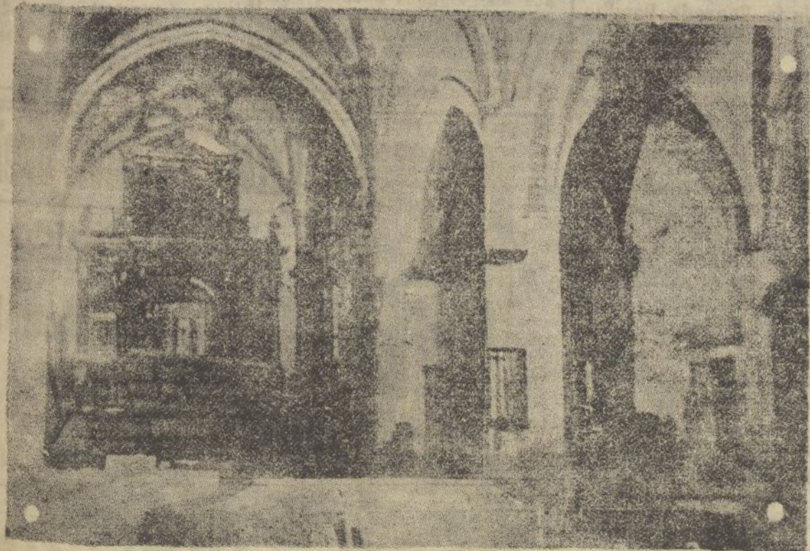
La iglesia de Lopera, convertida en cuadra y almacén de granos, por los rojos.