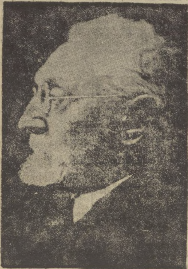
El insigne catedrático, honor de las letras españolas contemporáneas, D. Miguel de Unamuno