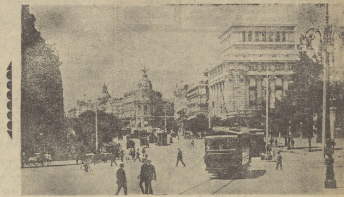
Otra soberbia perspectiva de la calle de ALCALÁ, una de las vías más alegres, animadas y espléndidas del mundo.