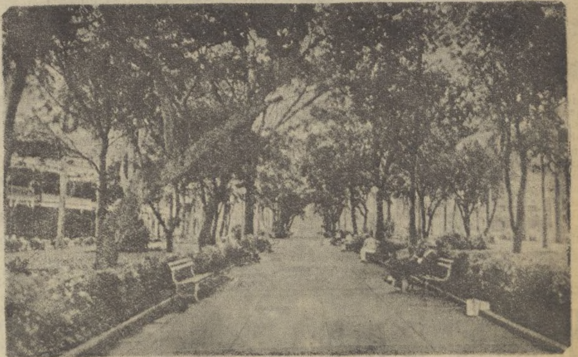
CIUDAD-COLON.—Paseo principal del parque de Colón

“Vigilad todos el espionaje enemigo. Denunciad y detened a los traidores,,