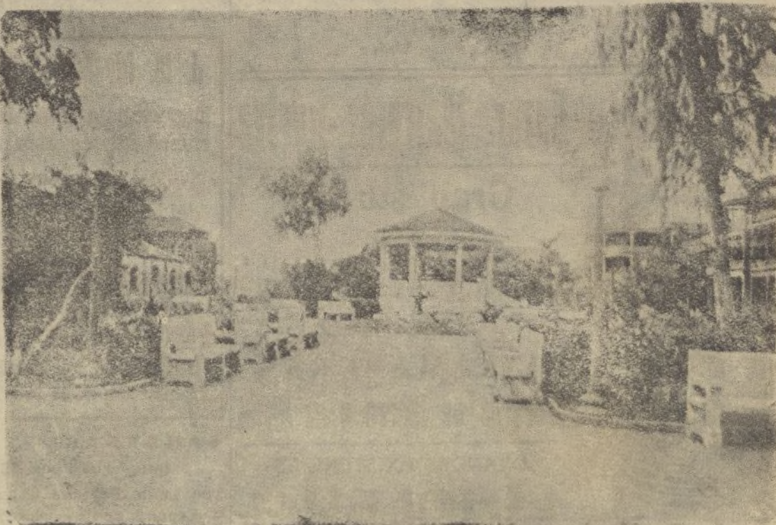
CIUDAD-COLÓN.—Parque de Colón

del Generalísimo Franco -:- Jefe del Estado Español Tamaño 50 x 35 Precio: 0'75 ptas.