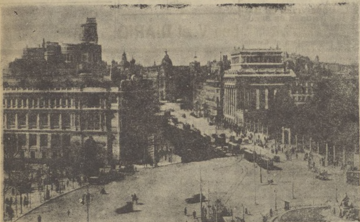
Soberbia perspectiva de la calle de Alcalá, monumental rampa que va desde la Cibeles a la Puerta del Sol. Ahí vemos en primer término el Banco de España, cuyo áureo metal, cuidadosamente guardado en sus sótanos, ha sido robado y exportado a Francia y Rusia.