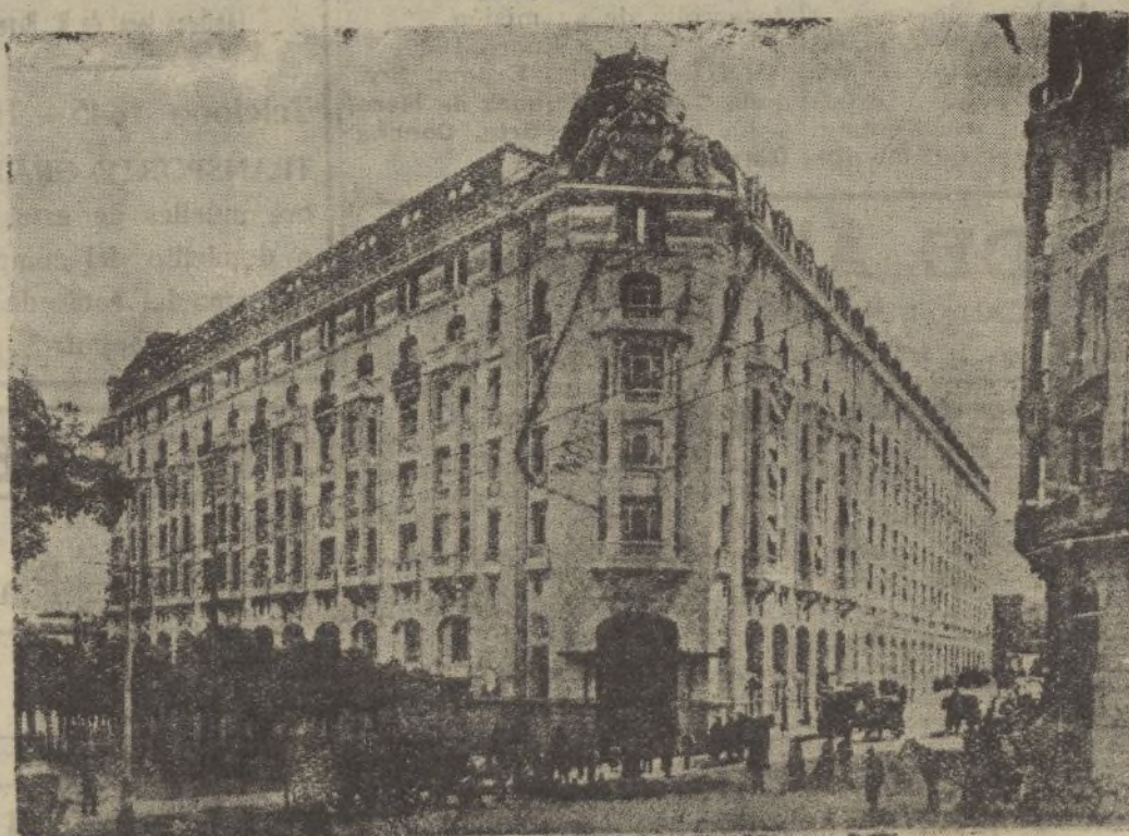
El Palace Hotel, el alojamiento de viajeros más capaz de España y uno de los mejores Hoteles del mundo. Se dice de él que ha quedado destruido, así como el Ritz y el Savoy. ¡Pobre Madrid!