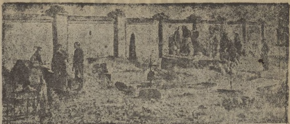
Cementerio de Pozuelo.—Posición avanzada de nuestras fuerzas en Madrid, antes del último avance

«Hay un zarismo rojo que emplea el látigo de cinco colas con remates de plomo, para castigos infamantes. Es el que manejan los rusos contra los milicianos a sus órdenes»