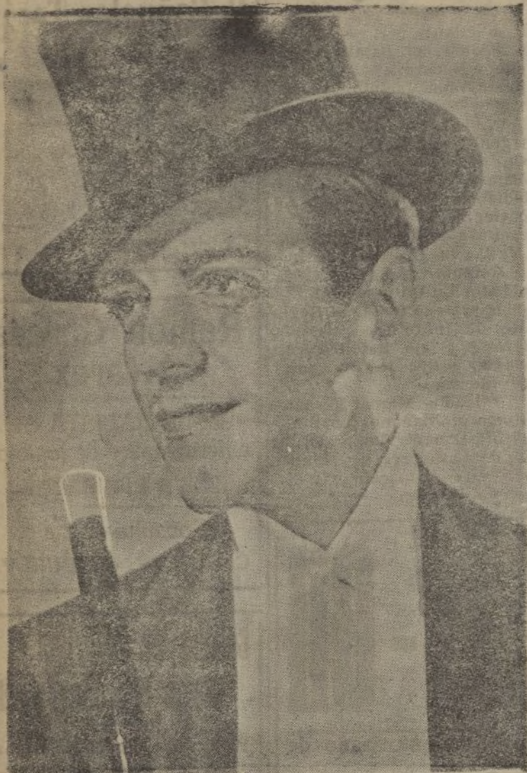
El famoso bailarín cinematográfico, Fred Astaire, creador de "La Carioca", "El Continental" y "Piccolino" y otros bailes modernos de películas