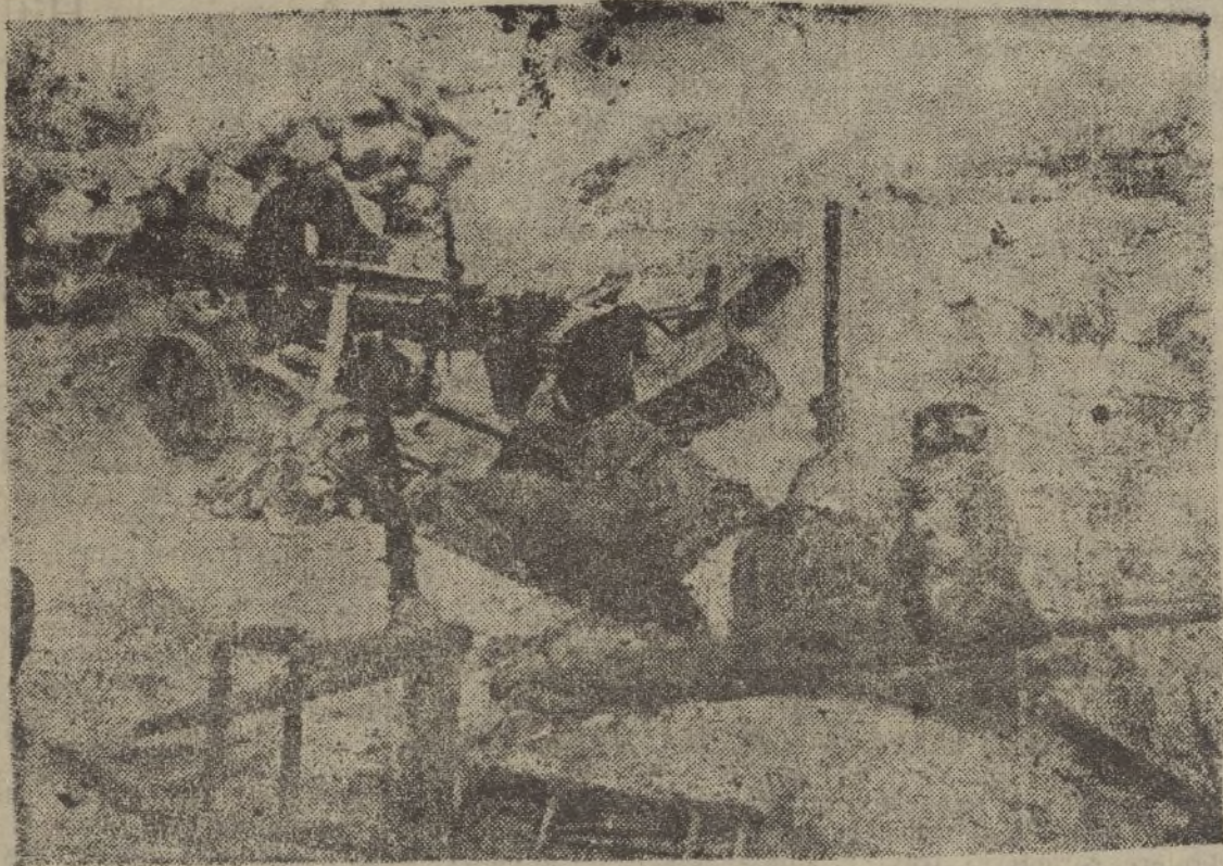
Miliciano comunista, servidor de una ametralladora rusa, encadenado por los pies a dos postes de hierro, muerto en el frente de Teruel.