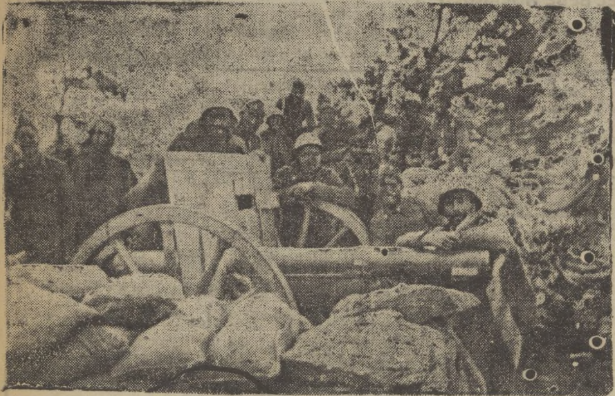
Echado sobre el cañón, el soldado de España permanece ante el objetivo en la posición montañosa, siempre alegre, a pesar de los sinsabores de la guerra.