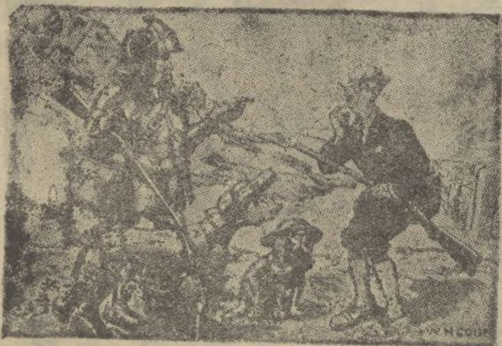
—No ponga esa cara de extrañeza al verme así. He cazado con usted hace unos meses.

Se realizan libros en la Papelería de DIARIO DE HUELVA