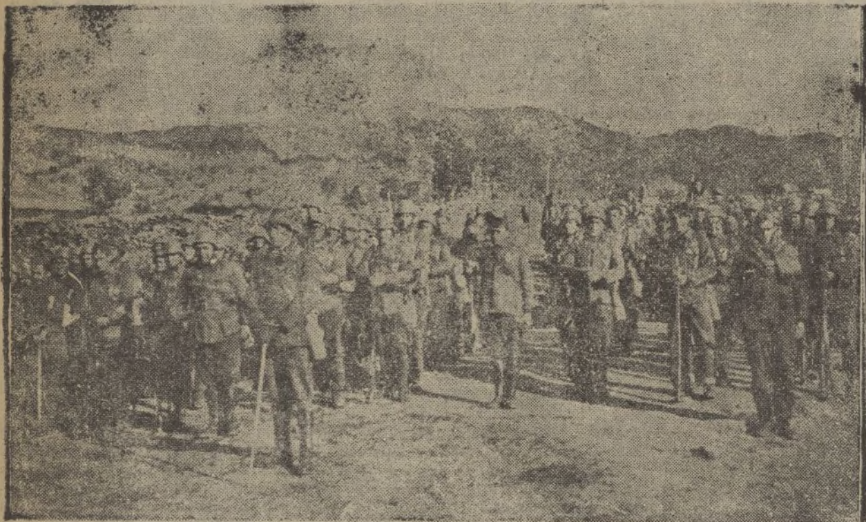
En la retaguardia de nuestro Ejército de operaciones.

X TODAS LAS MANANAS X LEA VD. X DIARIO DE HUELVA