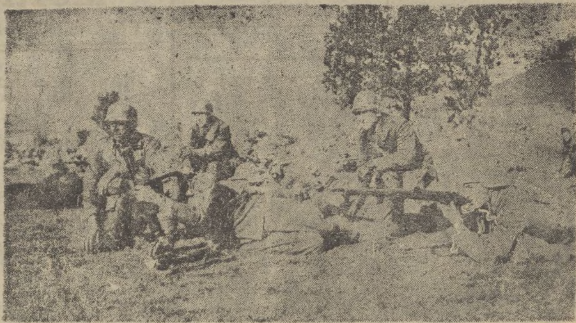
Punto de observación y ataque, precursor de un avance en nuestras líneas del frente madrileño

La seriedad y la buena orientación al formar un presupuesto no se revela en las cifras totales; la bondad de un presu-