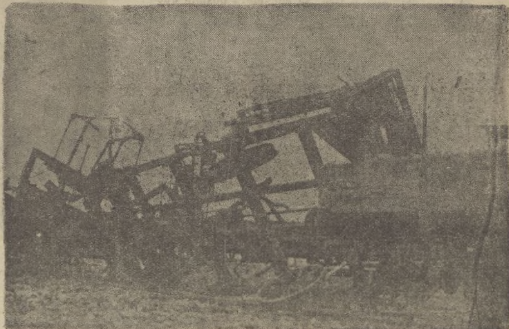
Tren destrozado en la estación de Pozuelo. Ayuntamiento de Madrid