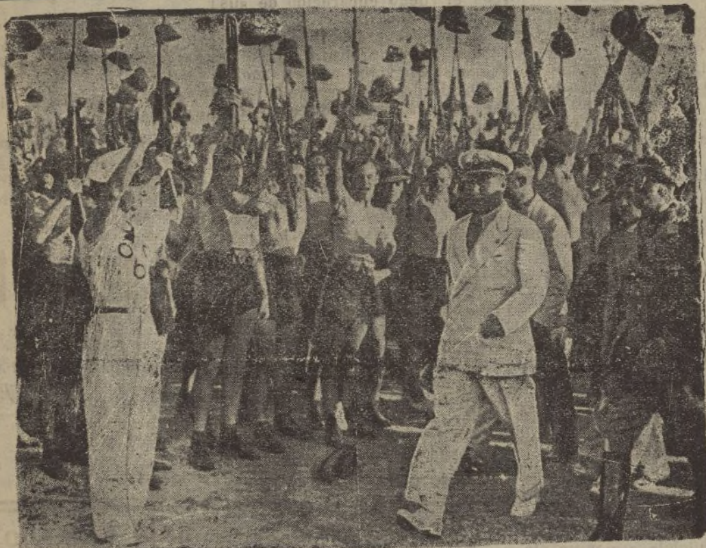
El «duce» aclamado por los «balillas» durante una visita a un campamento de «camisas negras»