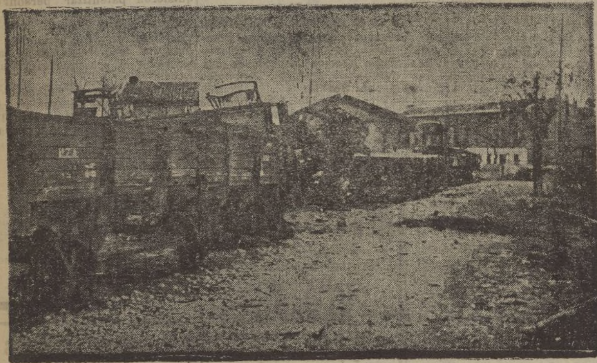
El material ferroviario de la estación de Pozuelo quedó casi destruido.