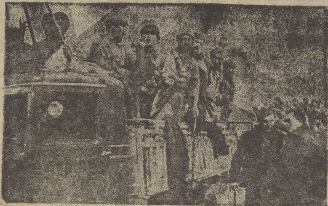
Un camión de fuerzas expedicionarias.

Mande usted su nombre y dirección juntamente con este cupón a Laboratorios Botánicos y Marinos, Ronda de la Universidad, 6, Barcelona y recibirá Vd. gratis y sin compromiso el interesante libro «La Medicina Vegetal», descriptivo de este maravilloso método curativo y el «Boletín Mensual» que reproduce las cartas demostrando su eficacia.