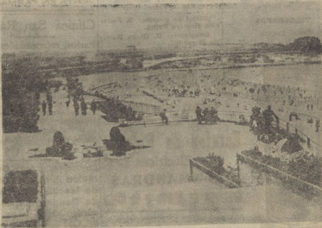
Vista parcial de las playas del Sardinero