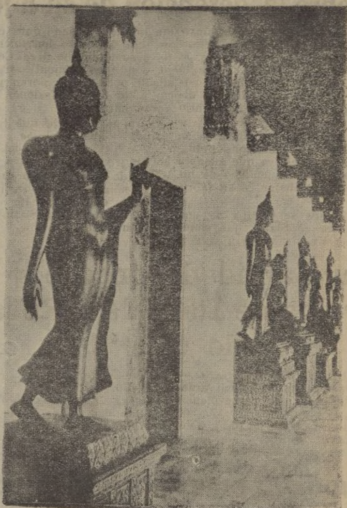
Estatuas de Benchambophit