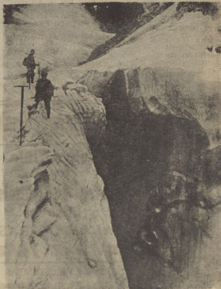
Pirineos Glaciar del Aneto

Para adquirir Confetis y Serpentinillas Papelería DIARIO DE HUELVA