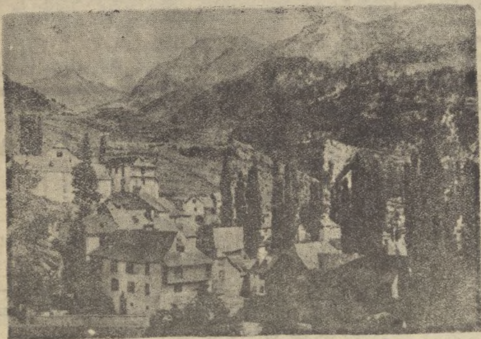
Vista parcial de Sallent y al fondo los Pirineos.