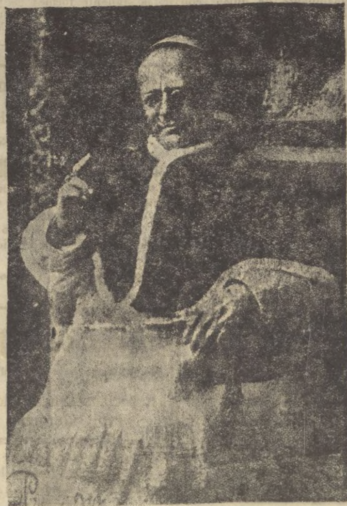
Su Santidad el Papa, cuyo XV aniversario de su coronación acaba de celebrarse en toda la cristiandad