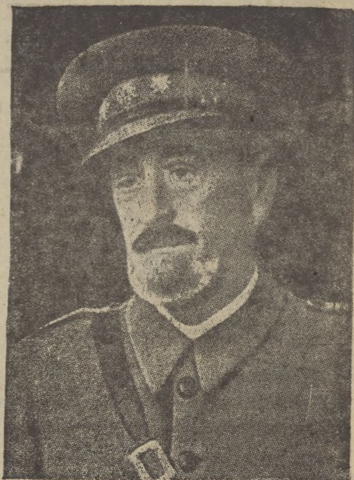
El laureado general Moscardó