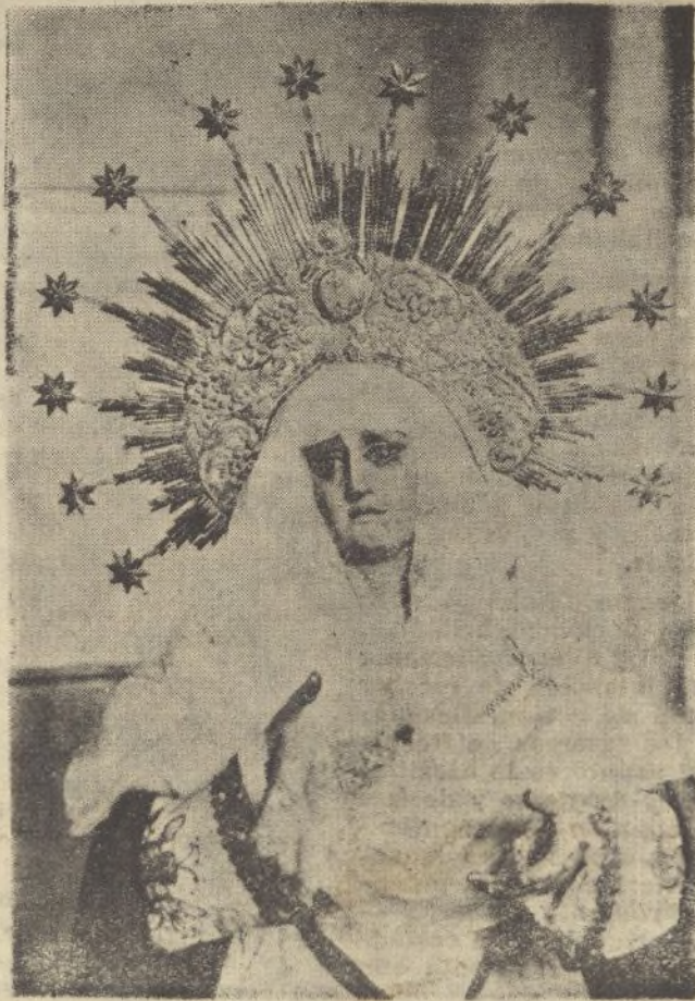
Nuestra Señora del Mayor Dolor, magnífica escultura que se veneraba en la iglesia de San Francisco, de nuestra capital