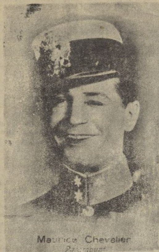
Maurice Chevalier París