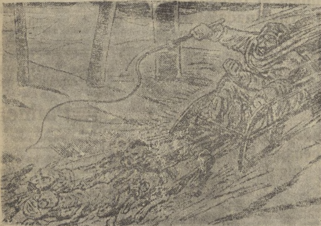
Stalin "anima" a su "tiro", Canallero, Azaña, Thorez, Jonhaux y Vandervelde