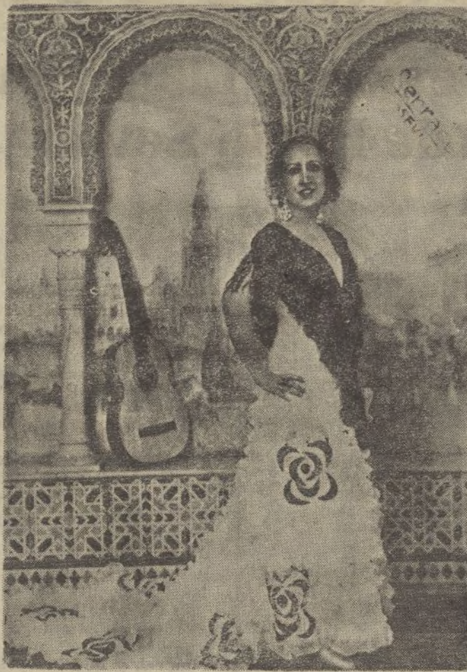
La bella y simpática bailarina andaluza que ha interpretado gustosamente estas alegrías.

Er cielo de añaí, embrujá la caye. La rosa de abrí, toito un alarde, mocita cañí.