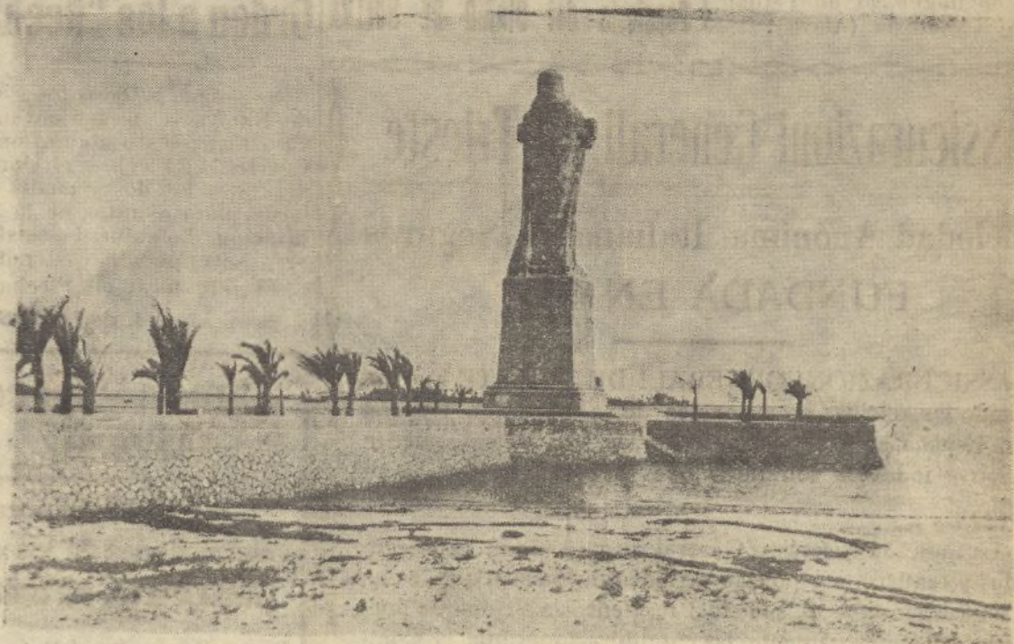
El colosal monumento a Colón, en las proximidades de la Punta del Sebo, regalo a la ciudad de Huelva de la escultora norteamericana M tes . Whitney