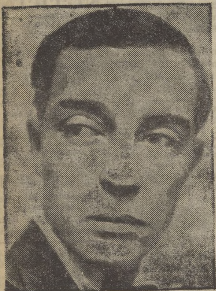
Buster Keaton (Pamplinas)