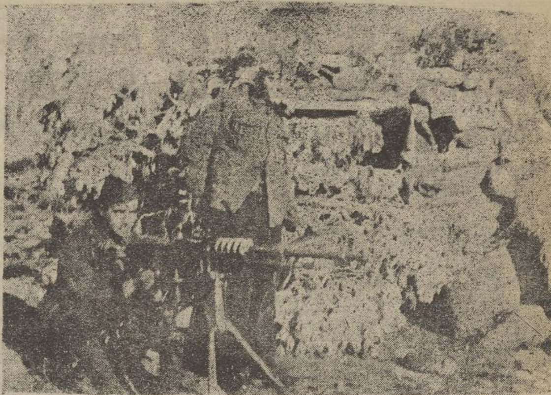
Nido de ametralladora protegiendo el constante y seguro avance de las tropas victoriosas del gran caudillo.