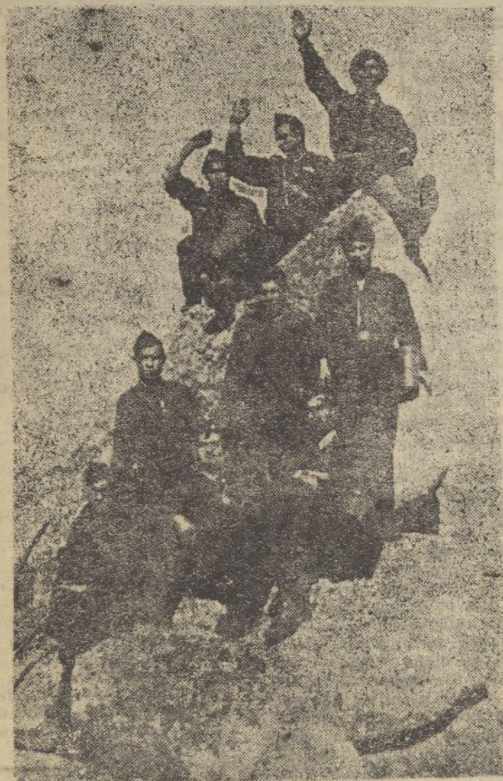
Falangistas, desde lo alto de la Sierra del Guadarrama, saludando desde lejos a la capital roja madrileña y que muy pronto será rescatada para siempre por las tropas sitiadoras.