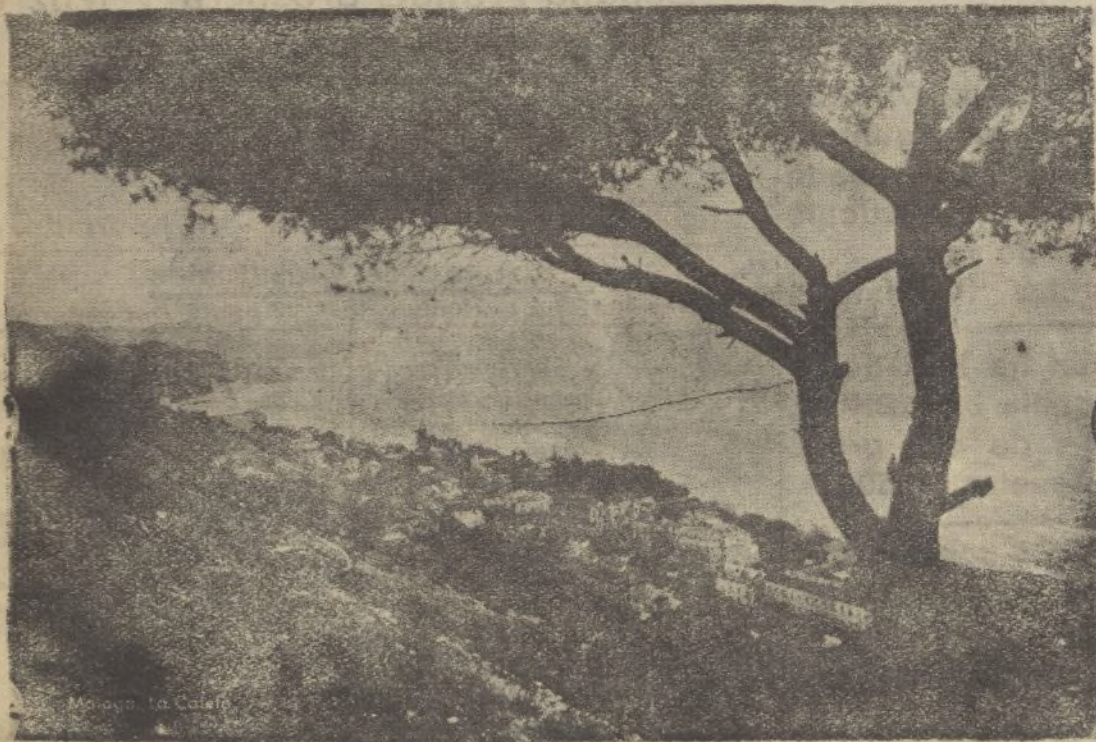
La Caleta, espléndida y aristocrática barriada malagueña brutalmente devastada por la barbarie roja