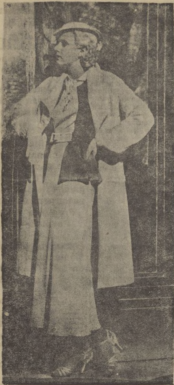
Jean Harlow, la de la platinada cabellera.

Los "flechas" de Huelva trabajan sin cesar para auxiliar a sus camaradas y hermanos de Málaga que han quedado en la mayor miseria por las satánicas hordas rojas.