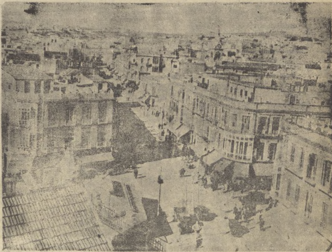
Un aspecto de la española, moderna y alegre ciudad de Melilla.