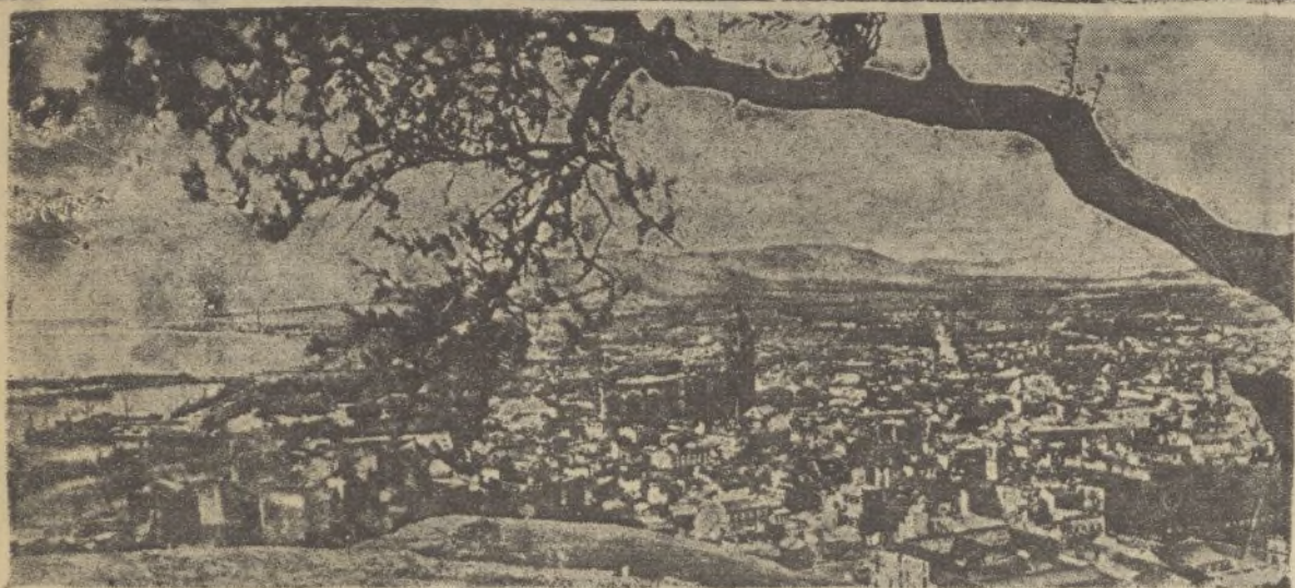
Vista general de la bellísima e infortunada capital mediterránea que empieza a despertar a la luz de una nueva aurora