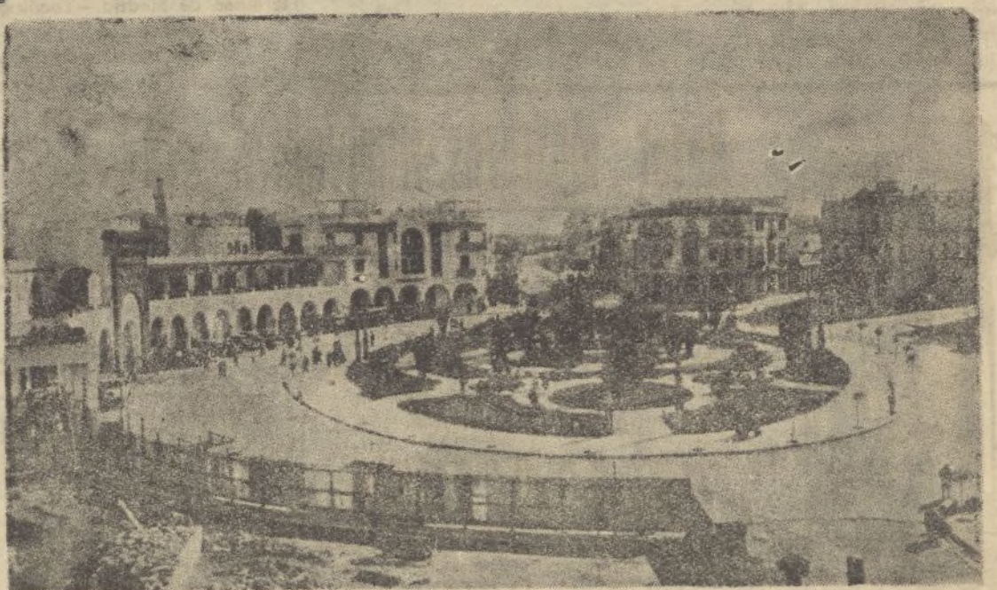
La hermosa plaza de España en Larache

Nuestras plazas de soberanía en Marruecos