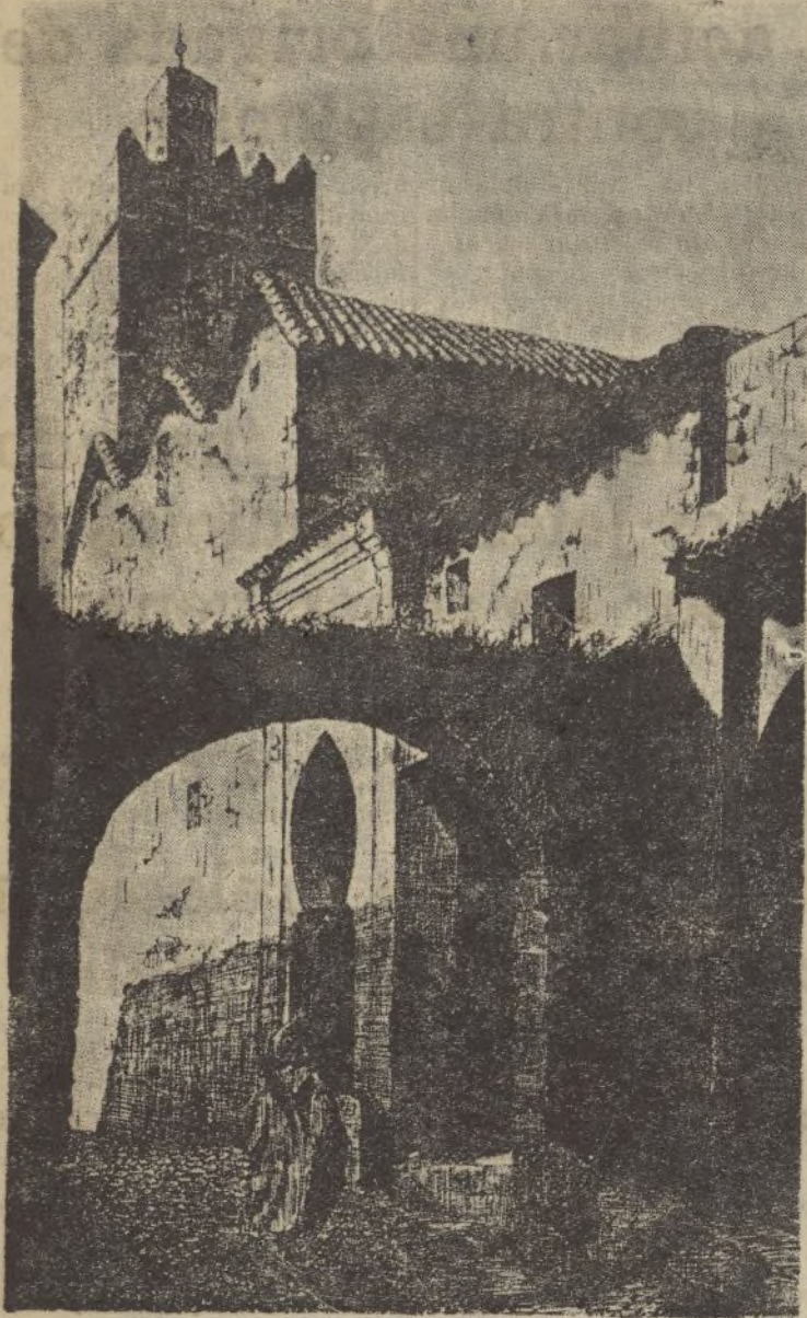
CONSTANTINOPLA.—Entrada del antiguo serrallo

“La familia y la fábrica serán la base de la nueva sociedad española. El futuro de España será comparable a una gran familia sin dueños, sin siervos, sin plutocracias, sin proletarios. Terminaremos con el odio de clases.”