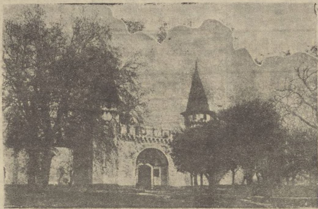
Un rincón de Xauen. (Dibujo de R. Guevara)