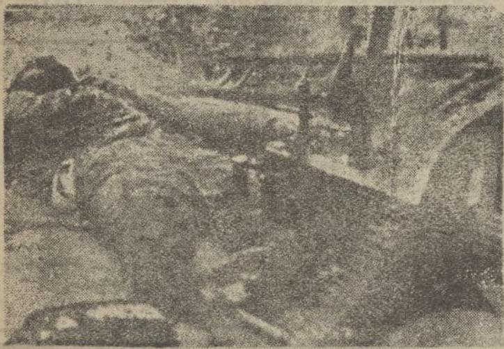
Un infeliz miliciano rojo, a quien los rusos bárbaros han encadenado junto a la ametralladora, como antes le habían hecho esclavo de un despotismo extraño contra su patria.