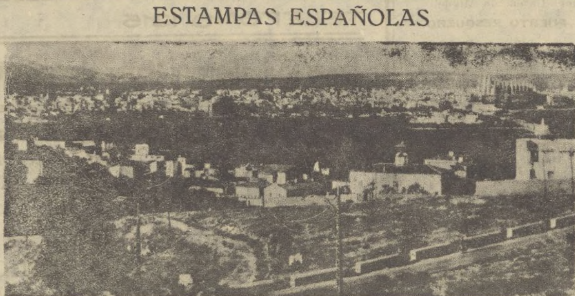
PALMA DE MALLORCA.—Vista general. Ayuntamiento de Madrid

BARCELONA, 10.—Esta tarde se radió una catilinaria tremenda contra el doctor Marañón, atacándole con toda clase de conceptos molestos. Estos ataques se amplían contra otros médicos, abogados, ingenieros e intelectuales que se han colocado al lado de España de Franco.