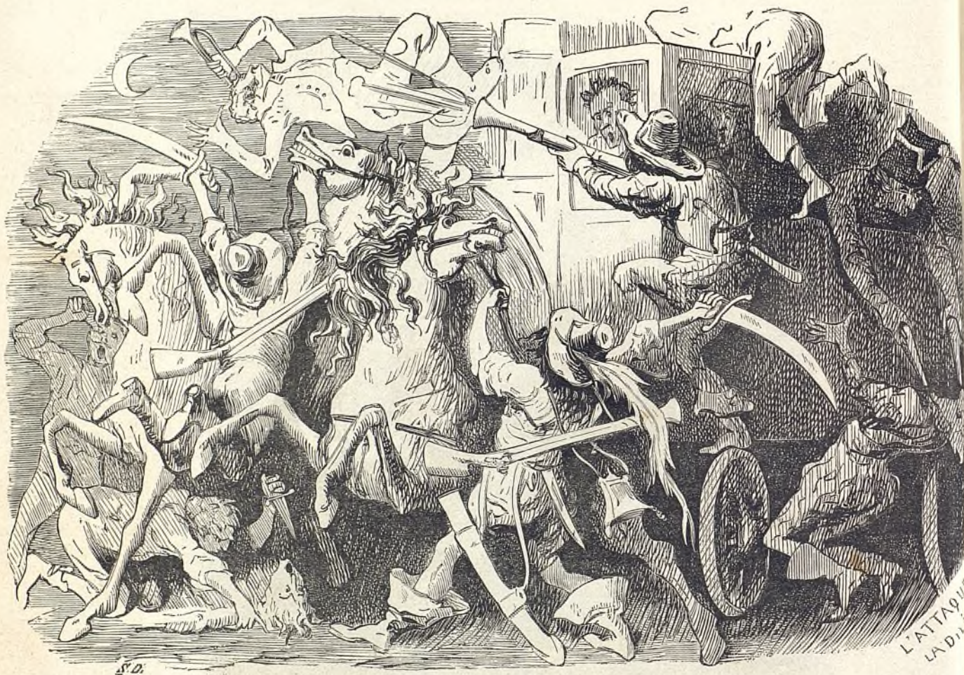
L'attaque de la diligence (vieux style).