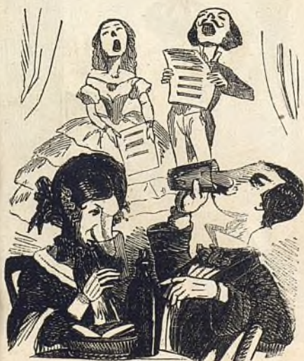
Les canards barbotent.