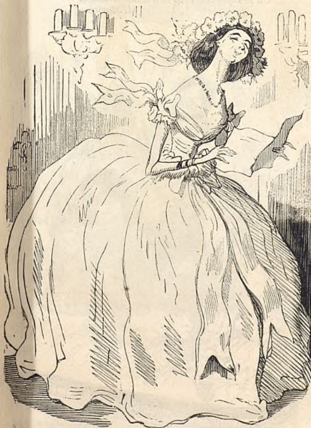
Ce que j'aime en toà C'est toà!