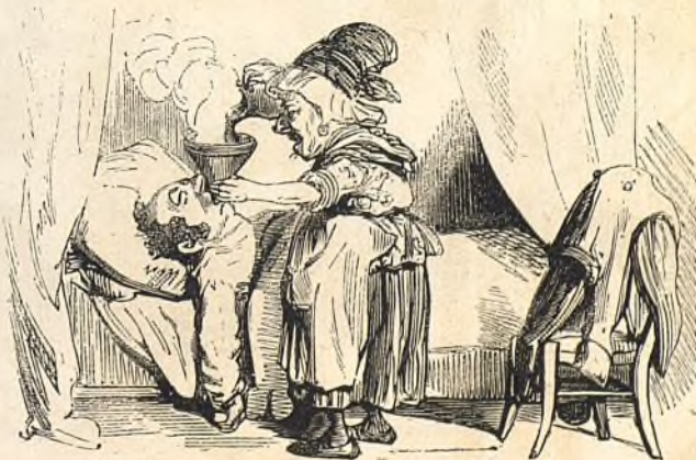
Mais il faut ensuite se faire transpirer!