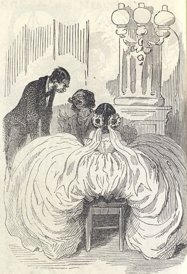
— Deux verres d'essence de térébenthine. — Monsieur, nous n'avons que de la chartreuse. — C'est ce que je voulais dire.