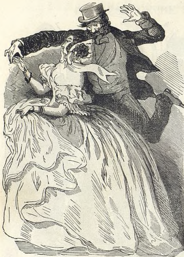
Pas nouveau, qui n'est pas neuf.