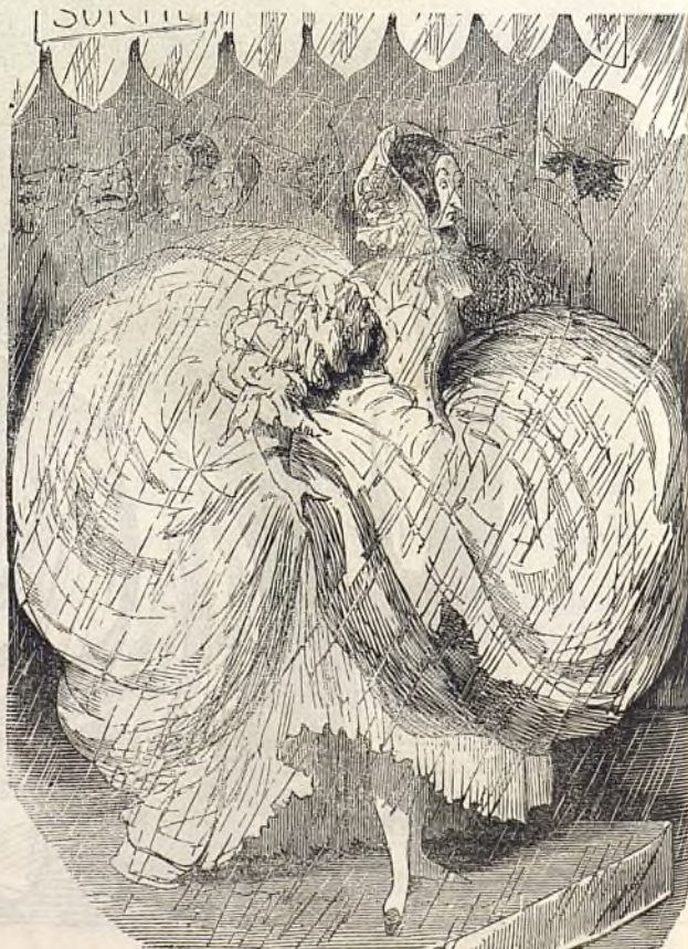
— Qui est-ce qui va m'offrir mon coupé?