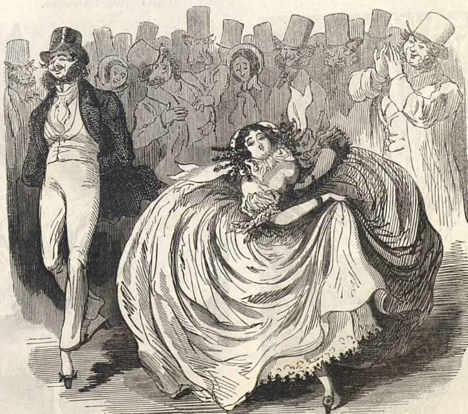
Corps de ballet.