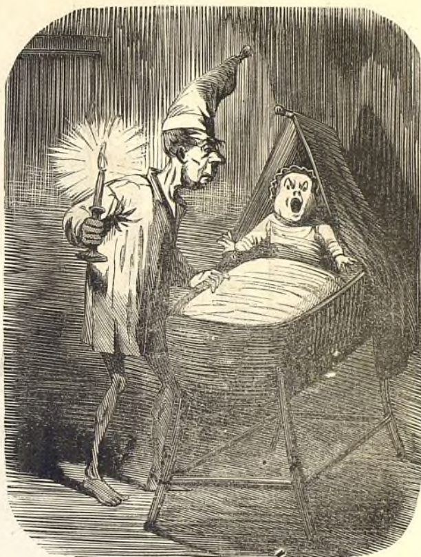
Six fois chaque nuit.