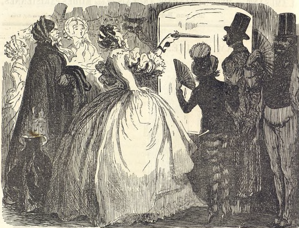
Le monde renversé.