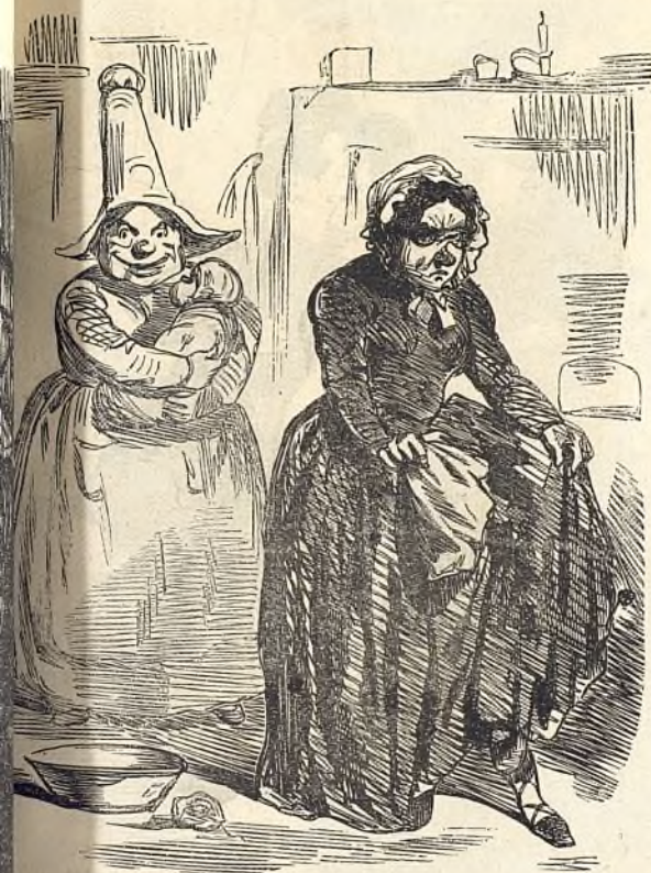
Tout n'est pas roses.....