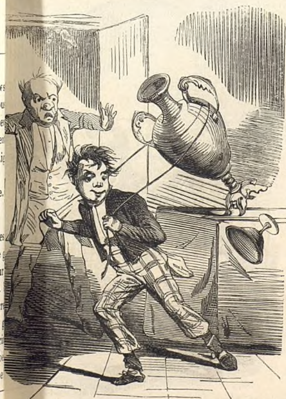
Il est un peu joueur,