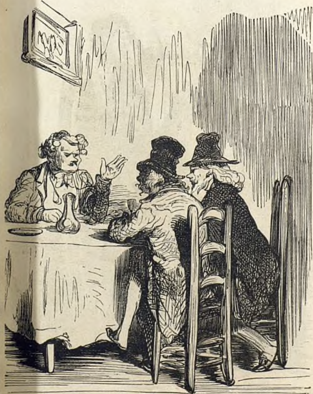
Le restaurant des artistes.