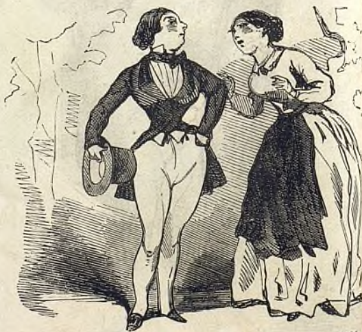
Ça me va-t'il bien ?