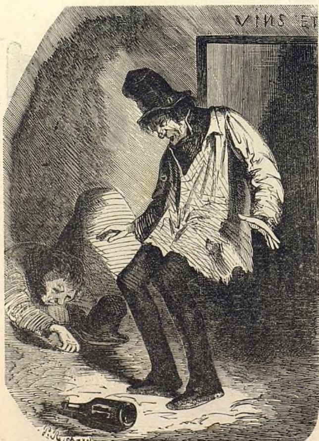
La raison humaine.