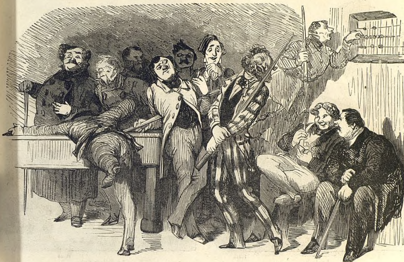
Le café des artistes.