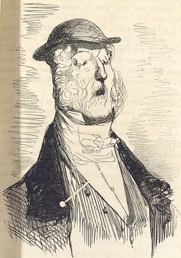
Le chef de la famille.