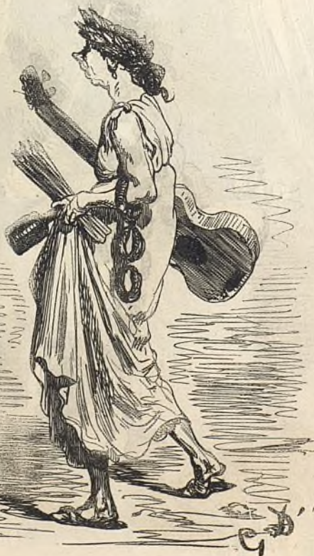
10245 Une muse.