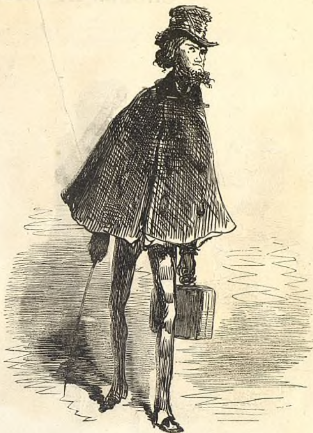
10243 Ayant foi dans l'avenir — et dans l'aaaaart!!!...