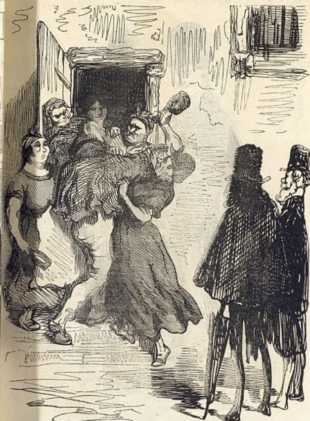
10230 Procédés qui seraient tout à fait déplacés dans le salon de madame Appony.