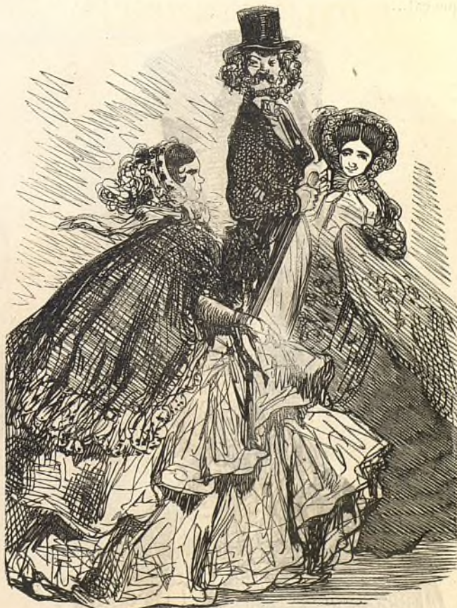
10231 « Les Parisiennes ont un charme qu'on ne trouve nulle part. » Ayuntamiento de Madrid (C'est quelquefois vrai !)