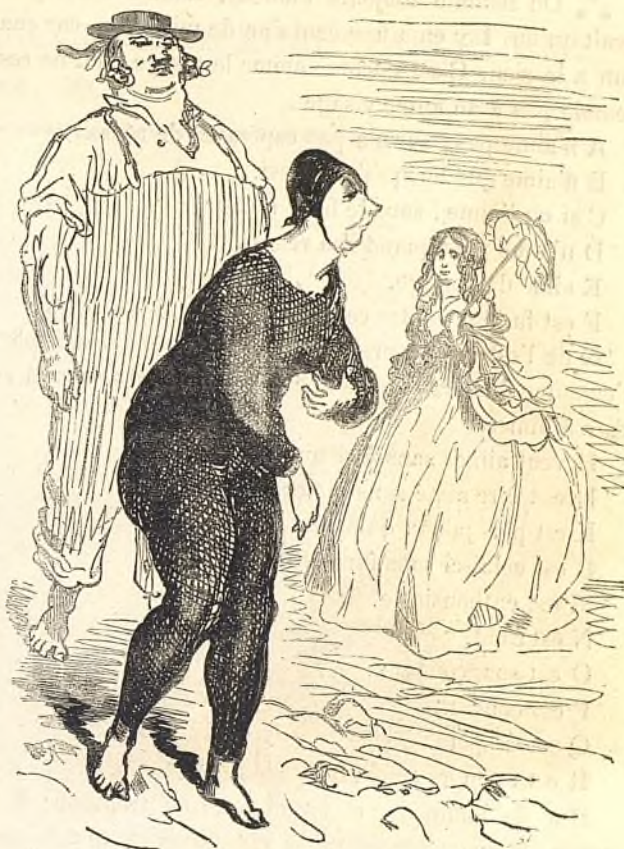
Sur la plage.