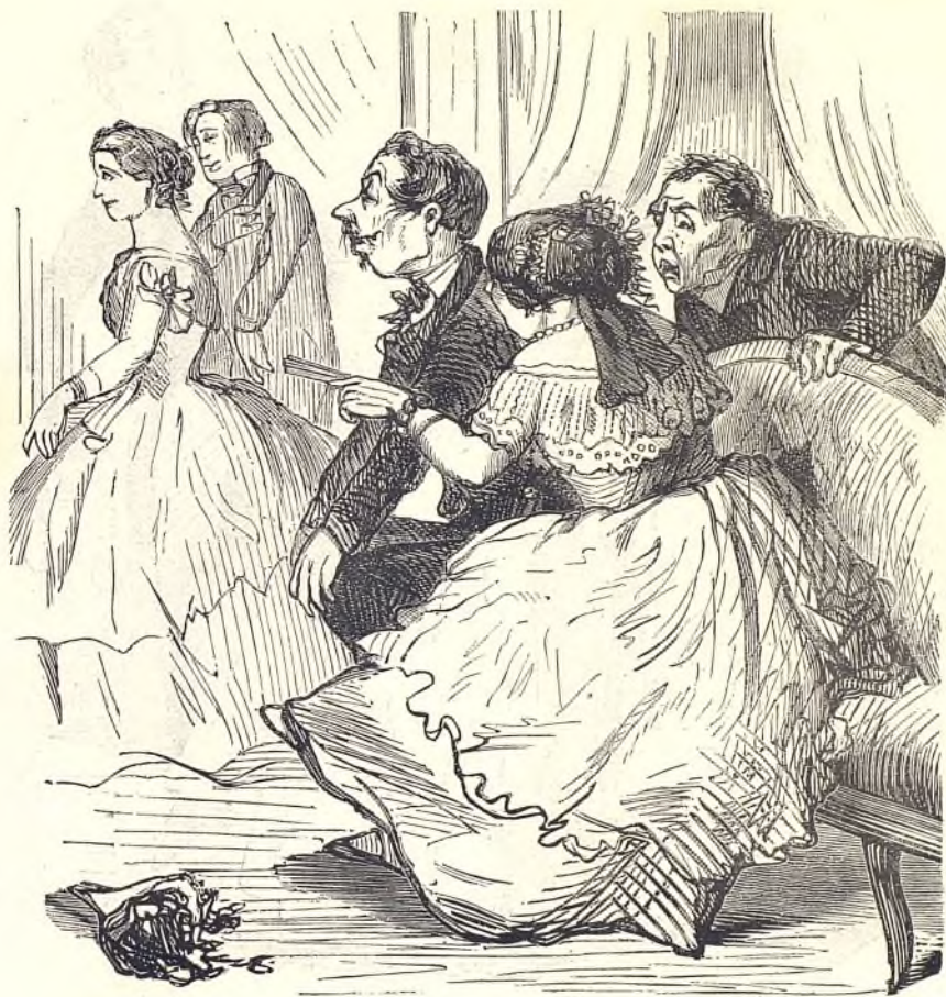
Une fille à placer.