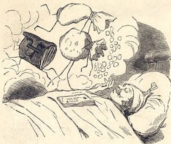
Un beau rêve.