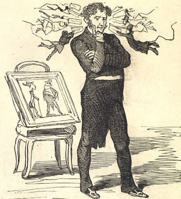
L'embarras du choix.