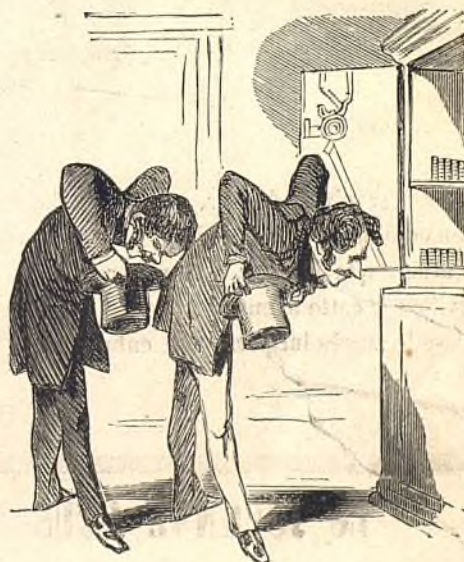
Le Dieu du jour.