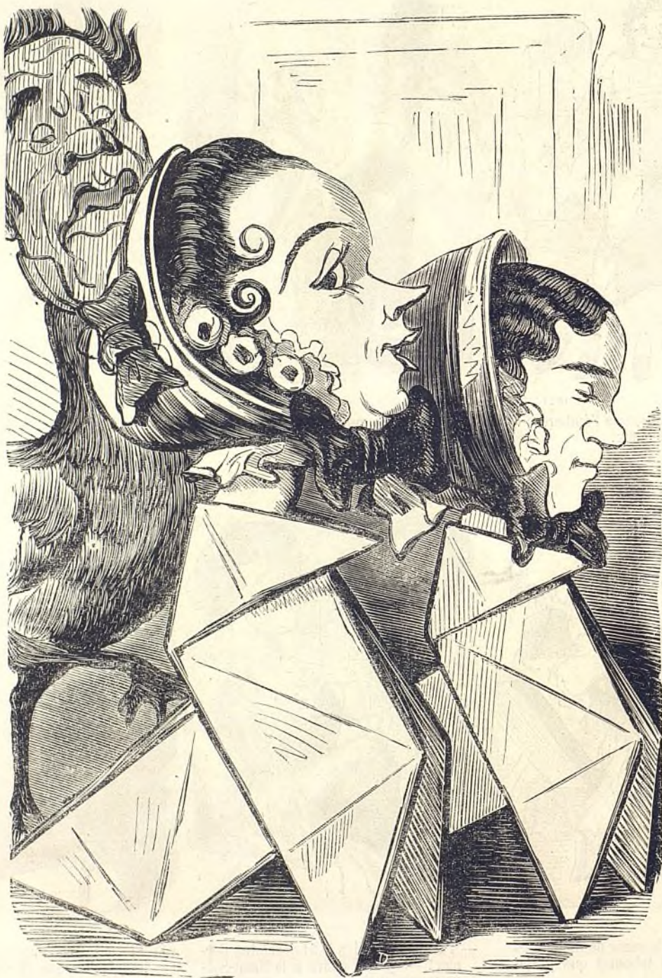
Ce qu'on appelle des cocottes.