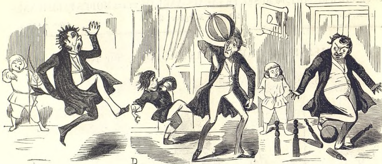
6918 Touché dans le mille!....