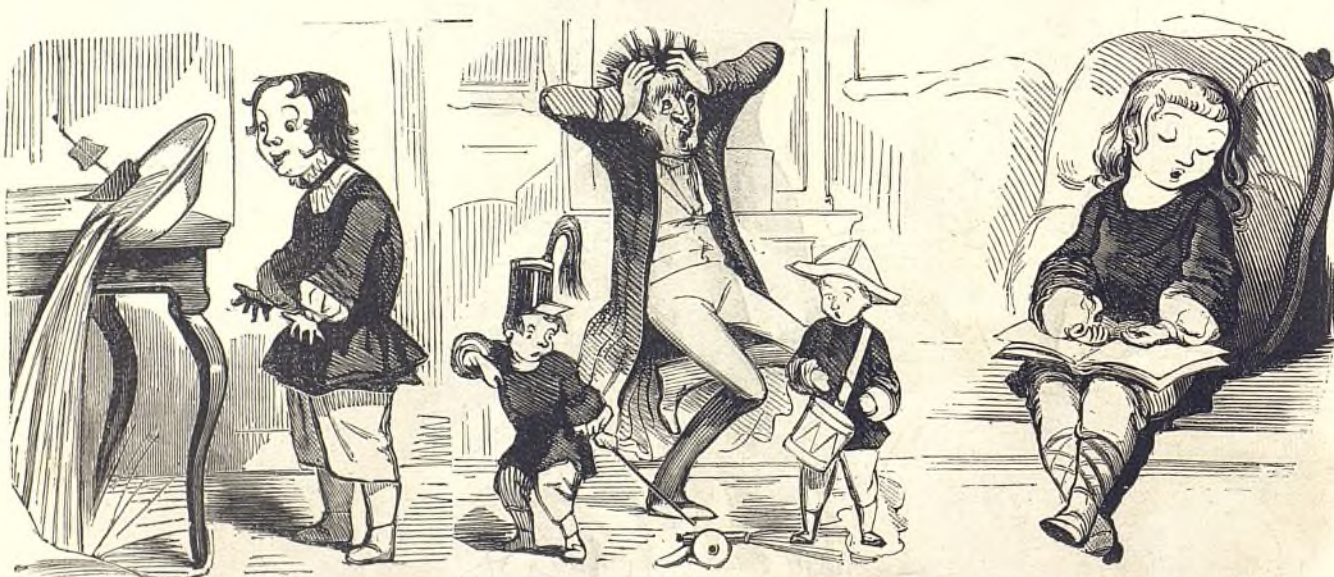
6912 Conséquences des étrennes maritimes.