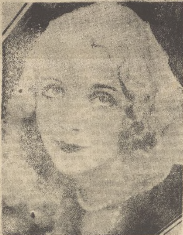
La espiritual "estrella" Virginia Bruce.