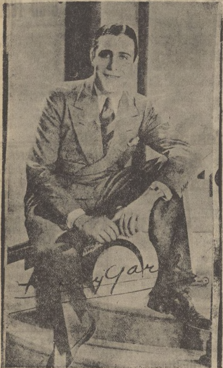
El notable galán joven francés, Henry Garat.