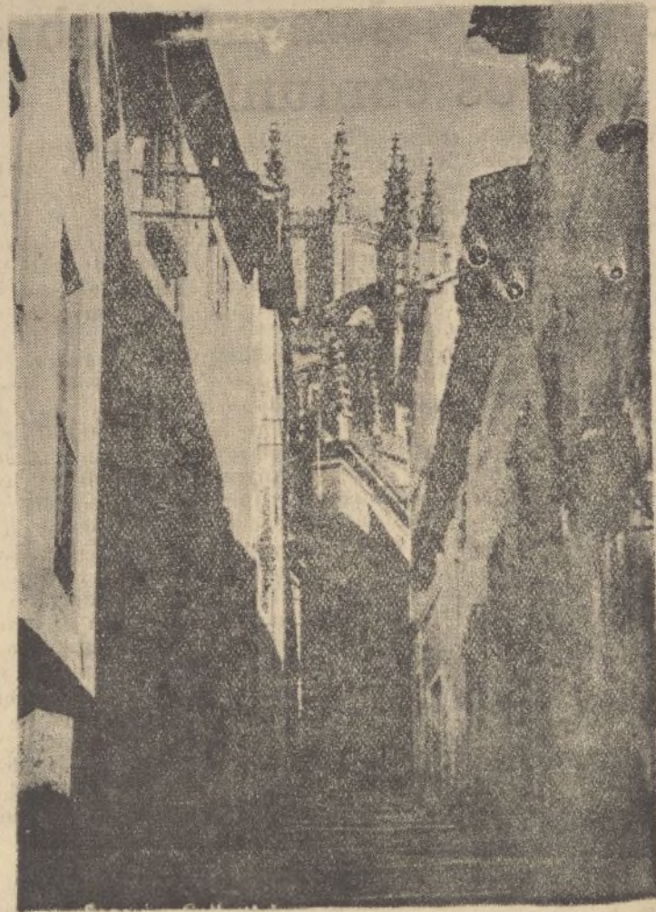
SEGOVIA.—Una calle típica