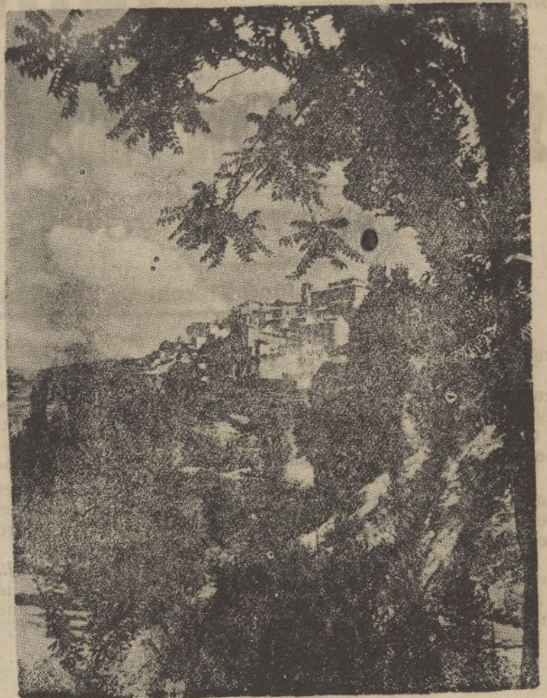
Vista parcial de Cuenca