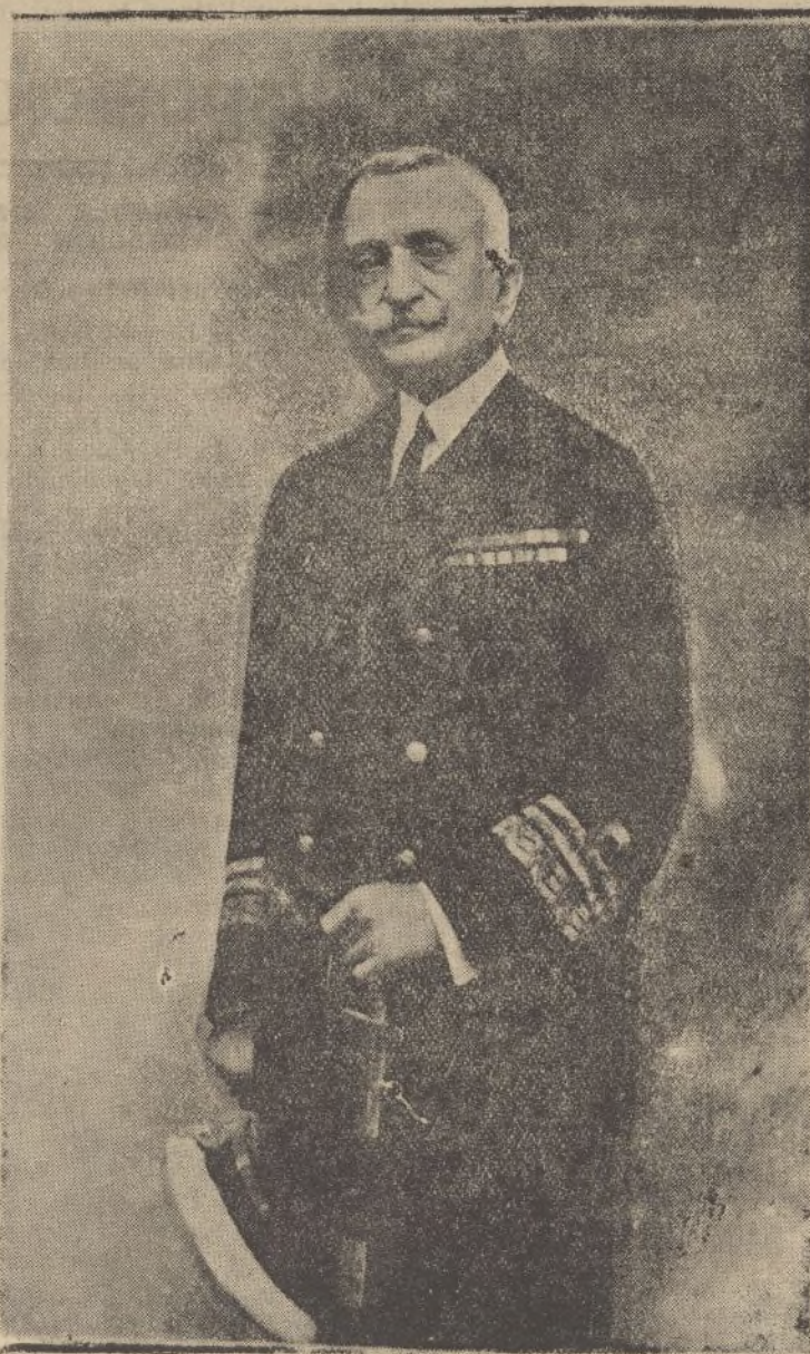
El ilustre marino, hijo de nuestra tierra, Honorio Cornejo Carvajal: «Almirante del Sufrimiento» [Honor a su memoria]

rojos, y especialmente a las fuerzas marxistas que como veteranas y aguerridas mandó el Gobierno de Valencia para oponerse, inútilmente, al avance nacional en la sierra cordobesa, ya dominada en su casi totalidad por las fuerzas del Ejército del Sur.