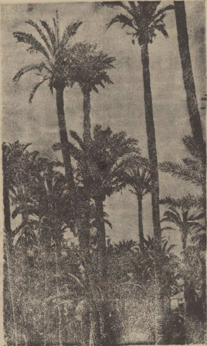
ALICANTE.—Palmeral de Elche.

“Ya hemos dictado leyes para terminar con el paro. Estamos mejorando la clase pobre y ayudando a la clase media a educar a sus hijos y darle una carrera. Hemos garantizado la ayuda del Estado para los tuberculosos”