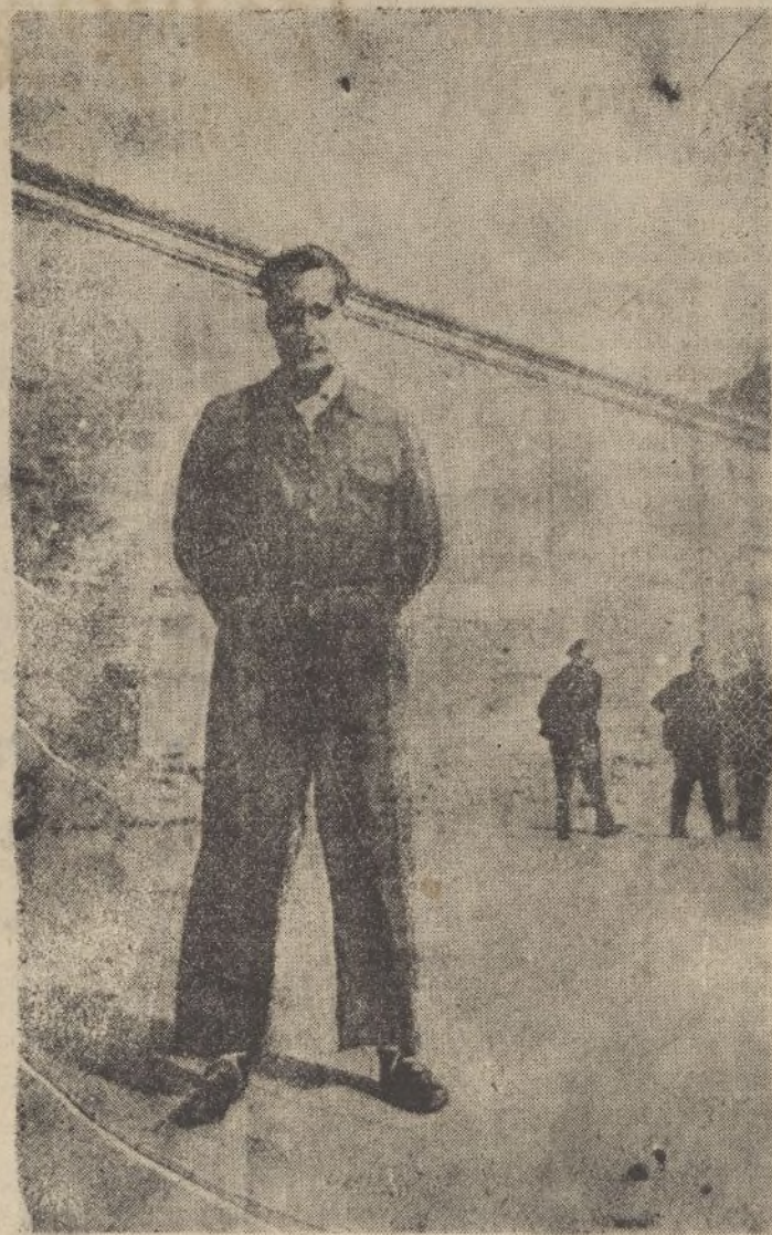
José Antonio Primo de Rivera, verbo de la Falange, en uno de los patios de la Cárcel Modelo, donde injustamente lo recluyó, hace un año, el Gobierno marxista.