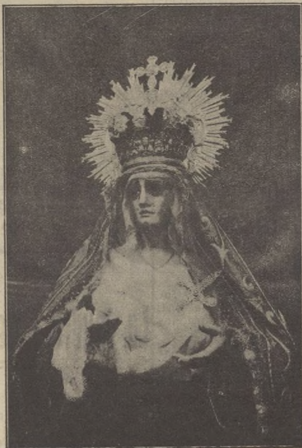
Maria Santísima del Mayor Dolor, apreciadísima y devota efigie que también fué pasto de las llamas pero que sus cofrades han hecho reproducir en una magnífica ampliación fotográfica que esta noche en su «paso», salvado providencialmente, hará estación, saliendo de la iglesia de San Francisco

tres de España. Dichos particulares fueron elaborados durante la pasada semana a consecuencia de la energética intervención del embajador de Italia, Di Grandi, en la reunión del 7 de marzo actual.