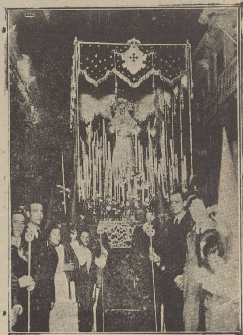
El «paso» de la Virgen de San Francisco, como vulgar y familiarmente se le llama, que saldrá en devota procesión esta noche.