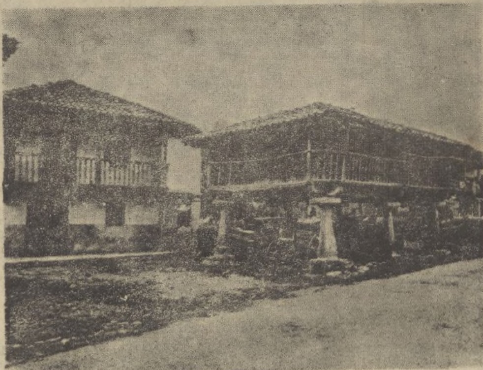
Cangas de Onís (Asturias).—Un «hórreo».

X LEA VD. X TODAS LAS MAÑANAS X DIARIO DE HUELVA