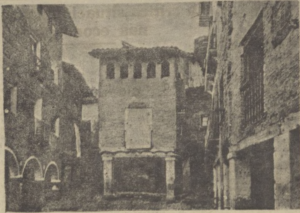
ALQUÉZAR (Huesca).—Típica casa particular