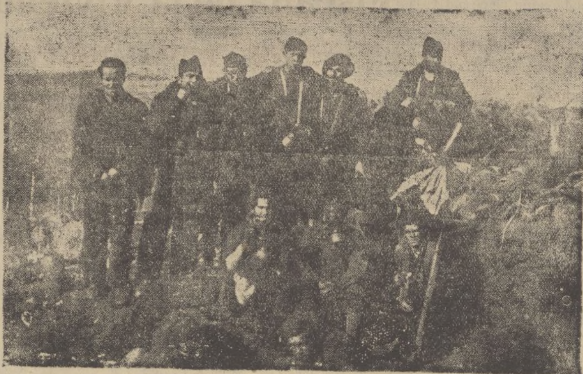
Falangistas al lado de su chavola