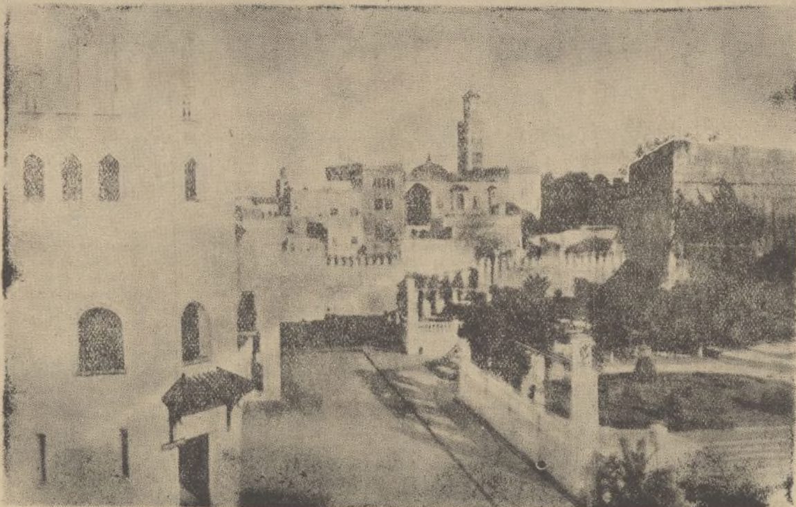
Un bellissimo rincón de la ciudad de Larache