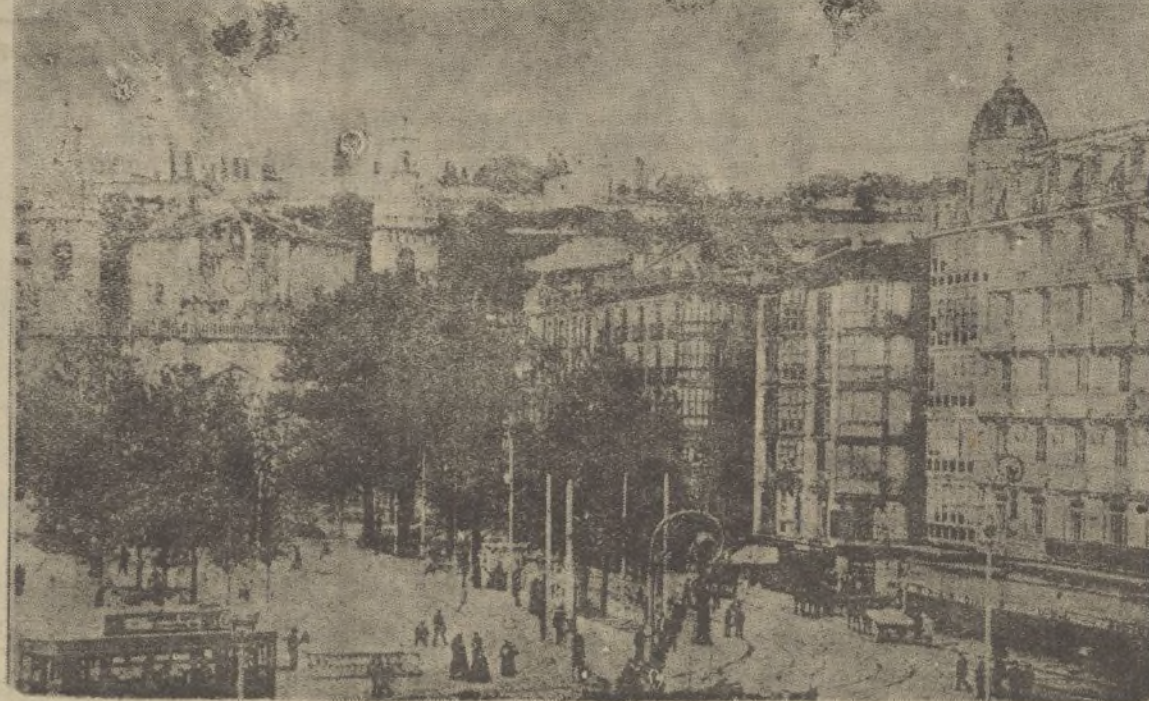
Boulevard y arenal