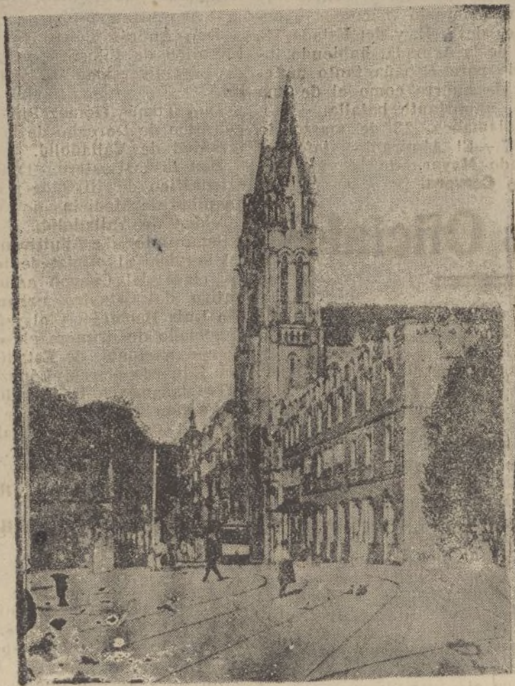
Iglesia de San Francisco