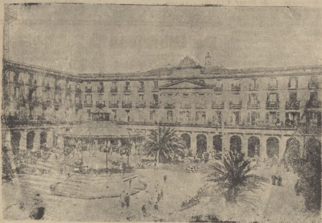
Plaza Nueva y Mercado Agrícola